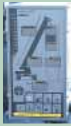
モーメントリミッタ

過負荷による転倒を防止するため、警報を発生して危険側（フック巻上、ブーム伏せ、ブーム伸ばし）への作動を自動停止します。また、「定格荷重」「実荷重」「限界地上揚程」「作業半径」「ブーム長さ」「ブーム角度」もデジタル表示。さらに、作業中の負荷率を10%おきランプで確認できます。